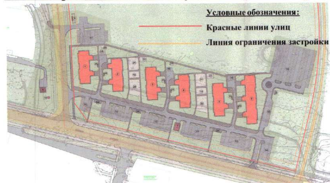
Схема ограничений по плану детальной планировки